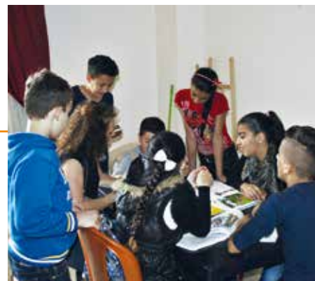
Les enfants Irakiens à El Kaa

De même grâce à votre aide, nous avons pu acheter un cabinet dentaire au